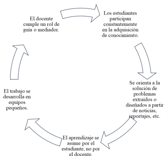
Figura 2: Características del Aprendizaje

Asimismo, el rendimiento académico debería ser considerado como un referente esencial cuando el proceso de enseñanza priorice que lo que aprenden los estudiantes sea realmente significativo. Entre las principales teorías que fundamentan esta postura se encuentra la del Aprendizaje Significativo. De este modo, Ausubel (1983) considera que un aprendizaje se convierte en significativo cuando el estudiante es capaz de generar conexión de la nueva información con su estructura mental anterior. Esta estructura cognitiva consiste en un conjunto de conceptos o ideas que los estudiantes ya poseen en determinado tema. La relación que se busca desde esta postura es lograr que los estudiantes puedan adquirir un nivel de conocimiento lo suficientemente complejo y sofisticado que le brinde posibilidades de acción en distintos contextos, ya sean estos locales o globales. De tal forma que los estudiantes no solamente adquieran un rol protagónico del sistema educativo, sino de la sociedad en general. Por lo tanto, se está tomando el aprendizaje como un todo constituido por múltiples factores. En la figura 2 se exponen los principales aspectos: