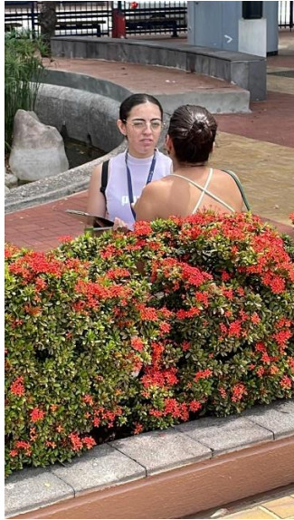
1Entrevista a mujer peruana