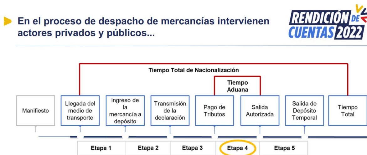
Gráfico 1 Proceso de Despacho de mercancías en Ecuador año 2022

demoras, sanciones y otros inconvenientes en el proceso de despacho aduanero. El uso de servicios de despacho aduanero en línea, el cumplimiento de normativas y requisitos, y la utilización de servicios integrales de un solo proveedor son algunas de las medidas que pueden contribuir a garantizar el cumplimiento de la normativa aduanera y agilizar los trámites aduaneros. Además, el respeto a la normativa aduanera es crucial para evitar sanciones y mantener la integridad de las operaciones comerciales en el ámbito del comercio exterior.